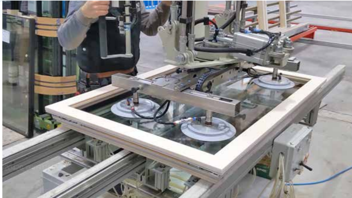
ZONA PER L'INSTALLAZIONE DEI VETRI AREA FOR GLASS INSTALLATION BEREICH FÜR DEN EINBAU VON GLAS ZONE POUR L'INSTALLATION DU VERRE