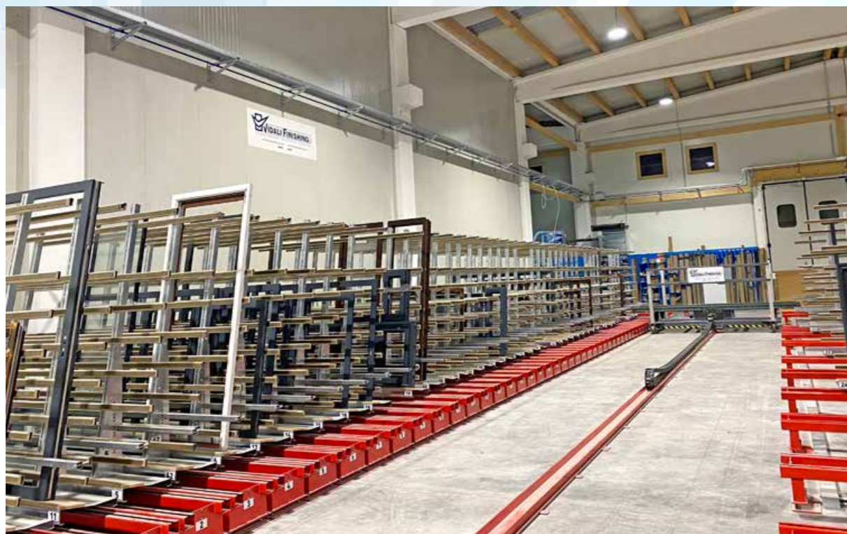
MAGAZZINO DI ACCUMULO ACCUMULATION STORAGE ANSAMMLUNGSLAGER ENTREPÔT DE STOCKAGE;