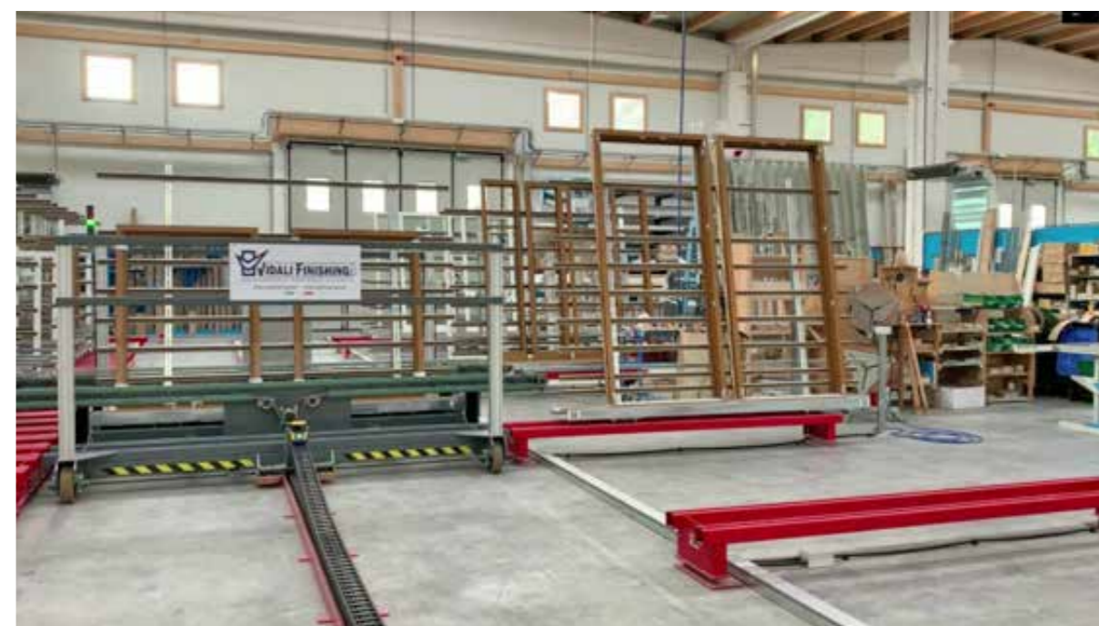
ZONA PER L'INSTALLAZIONE DELLE GUARNIZIONI; AREA FOR GASKET INSTALLATION BEREICH FÜR DEN EINBAU VON DICHTUNGEN ZONE POUR L'INSTALLATION DES JOINTS D'ÉTANCHÉITÉ.