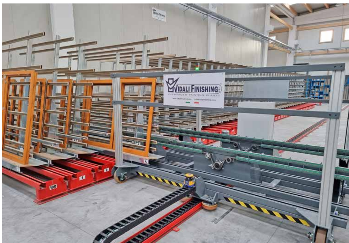
NAVETTA AUTOMATICA DI MOVIMENTAZIONE AUTOMATIC HANDLING SHUTTLE AUTOMATISCHER HANDHABUNGS- MANIPULATOR MANIPULATEUR DE MANUTENTION AUTOMATIQUE