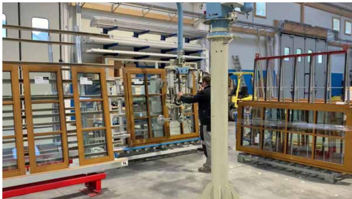
ZONA PER L'IMBALLAGGIO E SPEDIZIONE DEI PRODOTTI AREA FOR PACKING AND SHIPPING PRODUCTS BEREICH FÜR DIE VERPACKUNG UND DEN VERSAND DER PRODUKTE ZONE D'EMBALLAGE ET D'EXPÉDITION DES PRODUITS